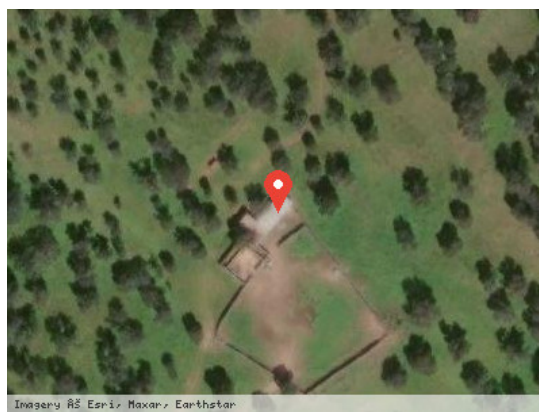
Imagery ©5 Earth Maxar, Earthstar Vista Satélite (Zoom)