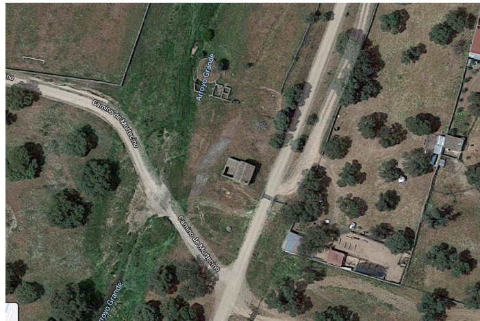
Localización casa 1