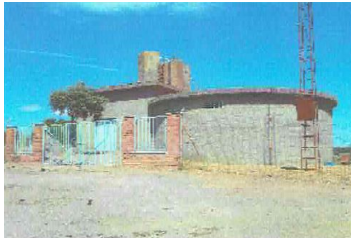
Imagen inventario precedente noviembre 2005